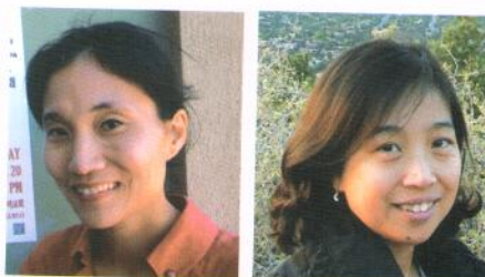
정리 | 학부모 통신원 이해원, 윤여림